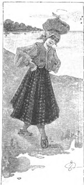
15 — Amori moderni.